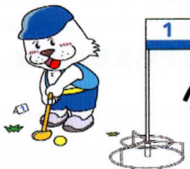
グランド・ゴルフ