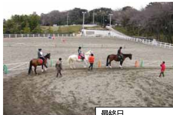
最終日 3 頭部班にチャレンジ （平成 18 年第 2 期）