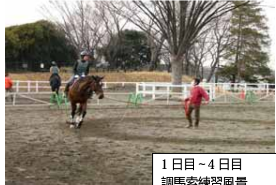
1 日目～4 日目 調馬索練習風景

馬の手入れと馬具の装着。 常歩での馬上体操。 調馬索での軽速歩練習。 もし参加者の皆様に余裕があれば・・・ 調馬索を外し3頭部班による常歩。 速歩、方向変換等もチャレンジします。