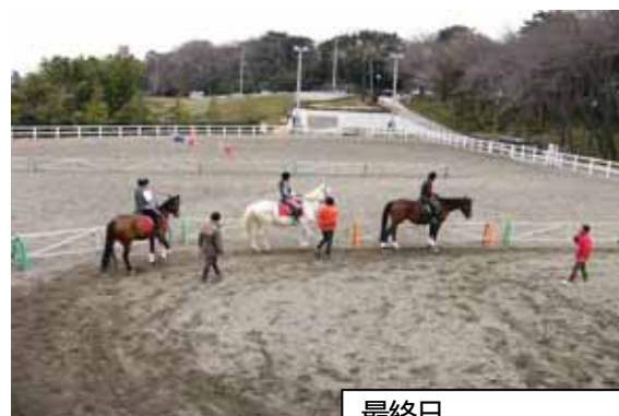
最終日 3 頭部班にチャレンジ （平成 18 年第 2 期）